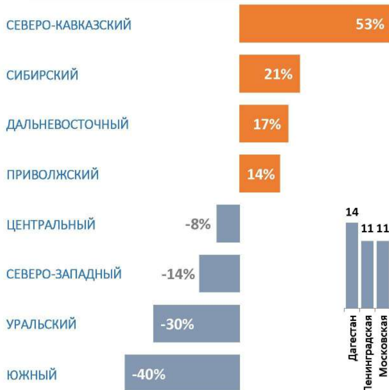
Динамика ДТП по федеральным округам, %