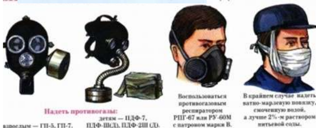
Надеть противогаз: взрослым — ГП-5, ГП-7, ПДФ-Ш(Д), ПДФ-2Ш(Д), детям — ПДФ-7, РПГ-67 или РУ-60М с патроном марки В. В крайнем случае надеть ватно-марлевую повязку, смоченную водой, а лучше 2%-м раствором питьевой соды.