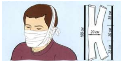
При отсутствии противогаза надеть ватно-марлевую повязку, пропитанную слабым раствором кислоты (при поражении аммиаком) или щёлочи (при поражении хлором)