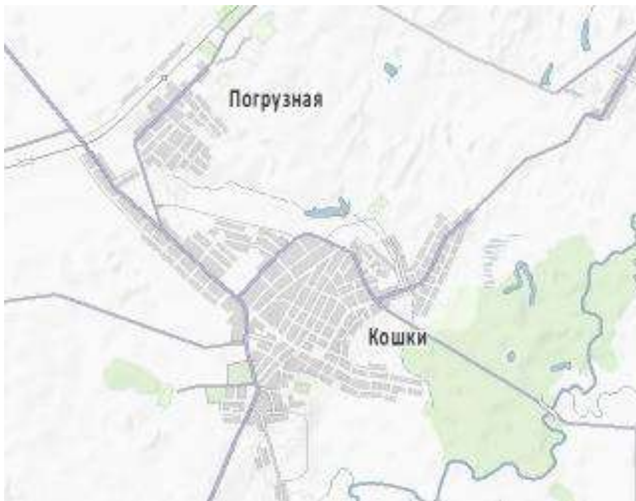
Рис. 2 – Расположение населенных пунктов с.п. Кошки

Расположение населенных пунктов с.п. Кошки в границах поселения представлено на рисунке 2.