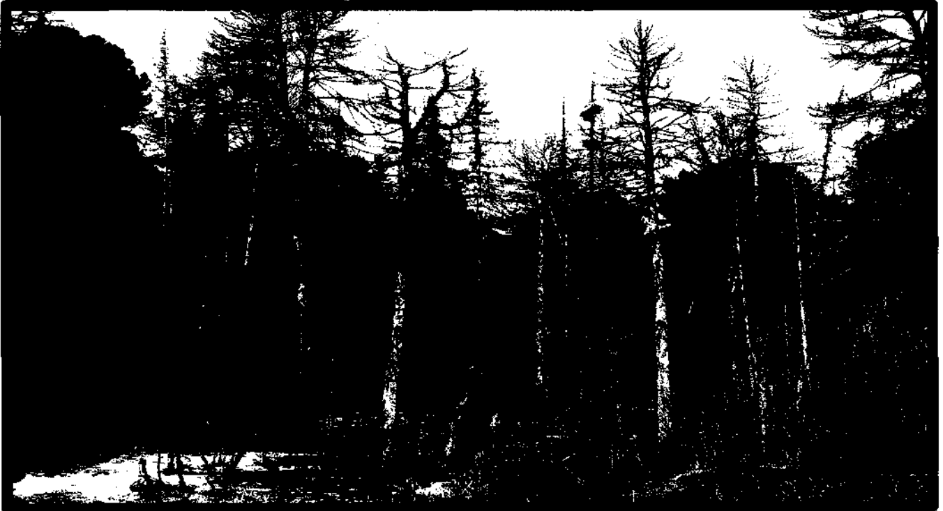
Изображение № 4 Сухостойное дерево. Не является валежником Изображение № 5

Кроме того, необходимо обратить внимание, что деревья, которые лежат на земле, но не имеют признаков естественного отмирания (имеют зеленую листву или хвою), определять как «мертвые» не допускается (смотри изображение № 5).