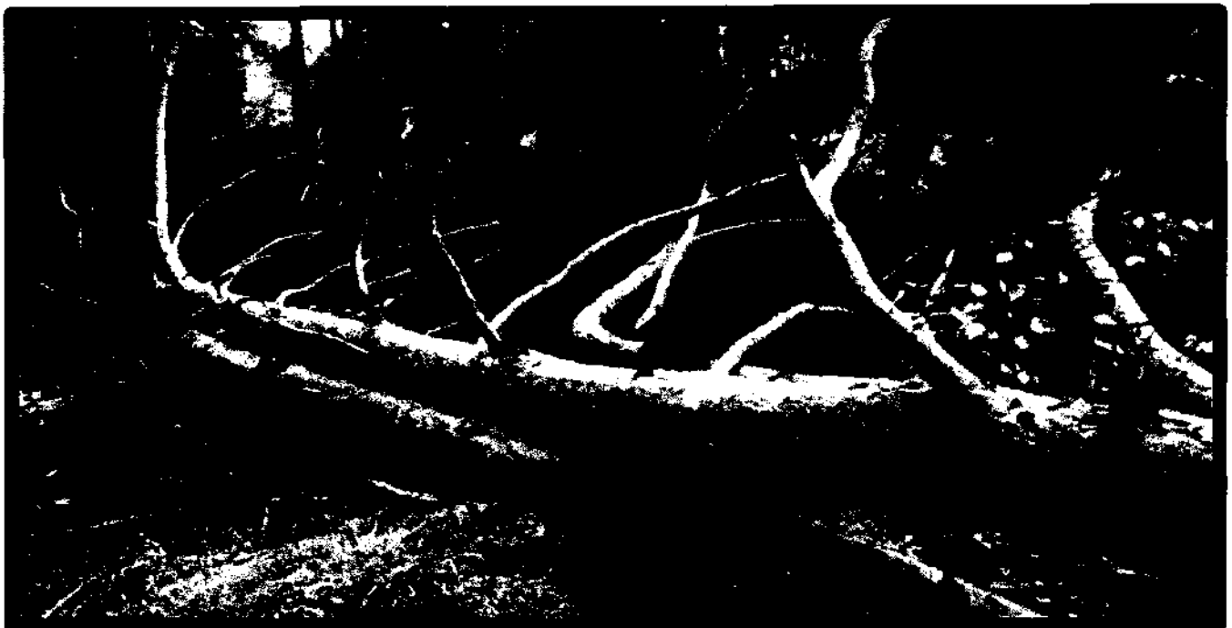
Лежащее на поверхности земли ветровальное дерево, не имеющее признаков отмирания. Не является валежником

Кроме того, необходимо обратить внимание, что деревья, которые лежат на земле, но не имеют признаков естественного отмирания (имеют зеленую листву или хвою), определять как «мертвые» не допускается (смотри изображение № 5).