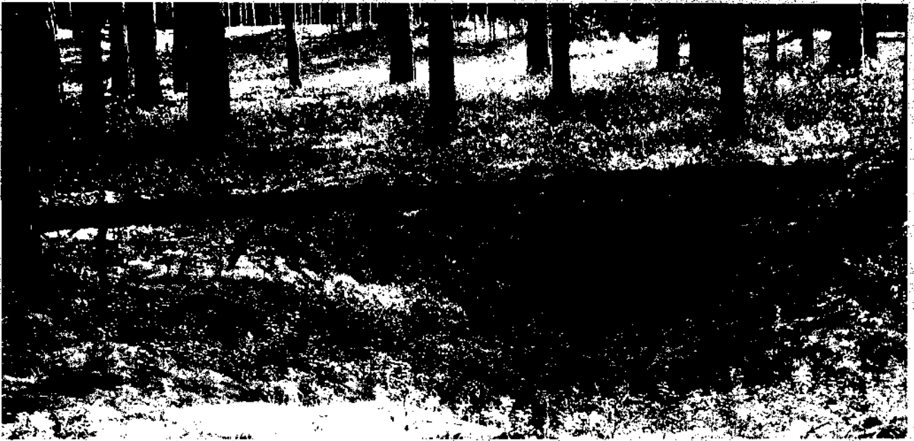
Изображение № 3 Валежник