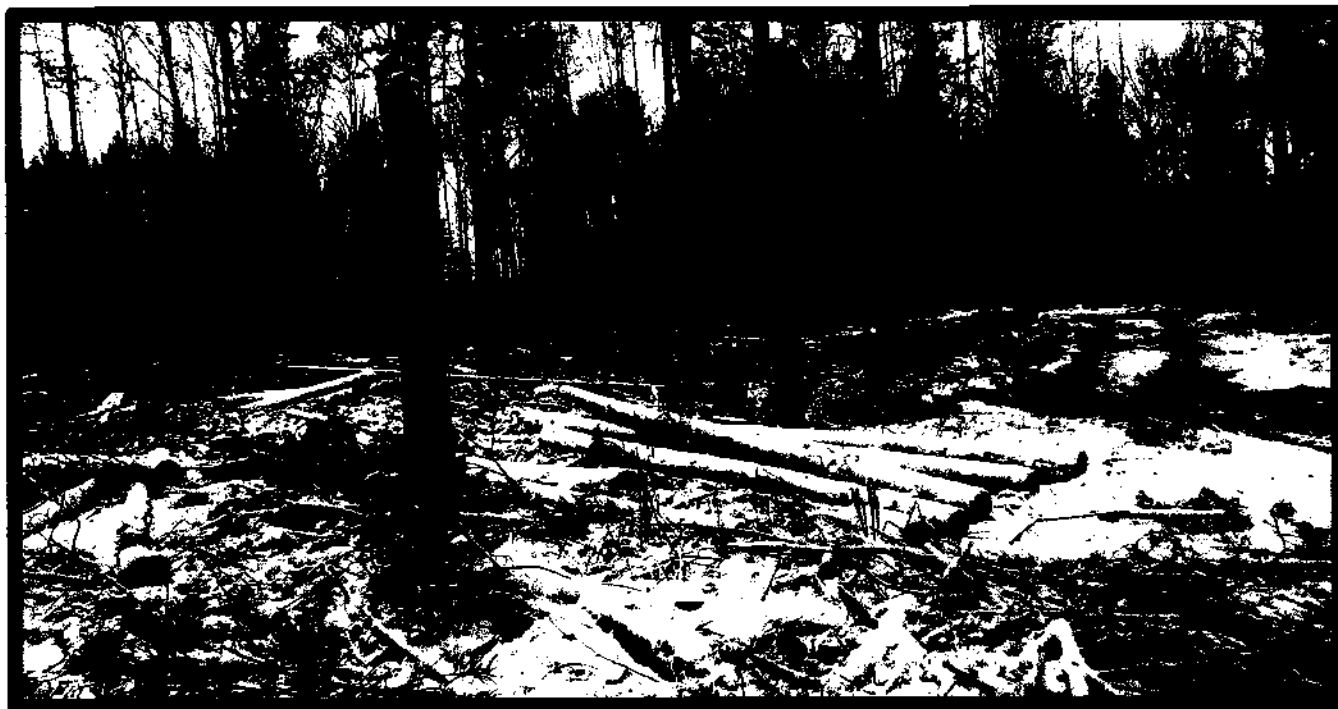
Изображение № 7 Брошенная древесина вдоль лесовозных дорог. Не является валежником