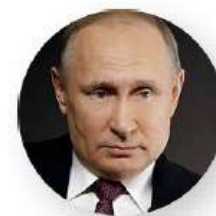
В.В. Путин Президент РФ

“ ...У нас в атомной промышленности мы реально работаем очень хорошо. Мы реально обогнали всех, мы больше всех делаем в мире атомных блоков для электростанций, это никакое не оружие, это высокие технологии... ”