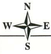
Схема организации улично-дорожной сети и схема движения транспорта на соответствующей территории для строительства объекта АО "РИТЭК" «Обустройство скважины № 23 Воздвиженского месторождения» в границах сельского поселения Русская Васильевка муниципального района Кошкинский Самарской области