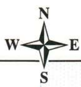
Схема использования территории в период подготовки планировки территории для строительства объекта АО "РИТЭК" «Обустройство скважины № 23 Воздвиженского месторождения» в границах сельского поселения Русская Васильевка муниципального района Кошкинский Самарской области