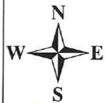
Схема расположения элемента планировочной структуры для строительства объекта АО "РИТЭК": «Обустройство скважины № 23 Воздвиженского месторождения» в границах сельского поселения Русская Васильевка муниципального района Кошкинский Самарской области