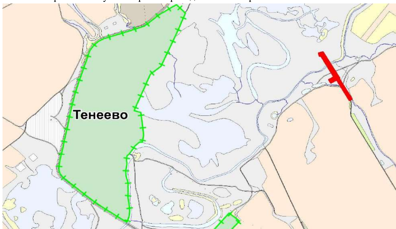
Рисунок 1.1 – Обзорная схема района работ

Обзорная схема участка работ приведена ниже на рис. 1.