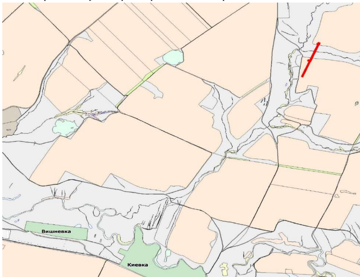
Рисунок 1.1 – Обзорная схема района работ

Обзорная схема участка работ приведена ниже на рис. 1.