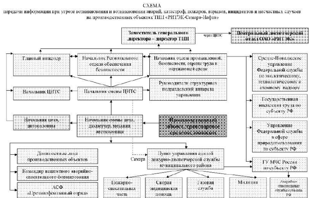
Схема 1. Схема организации взаимодействия, связи и оповещения в случае возникновения ЧС.

Персонал, обслуживающий проектируемые объекты Кутузовского месторождения, оповещается об угрозе или возникновении ЧС с помощью носимых радиостанций.