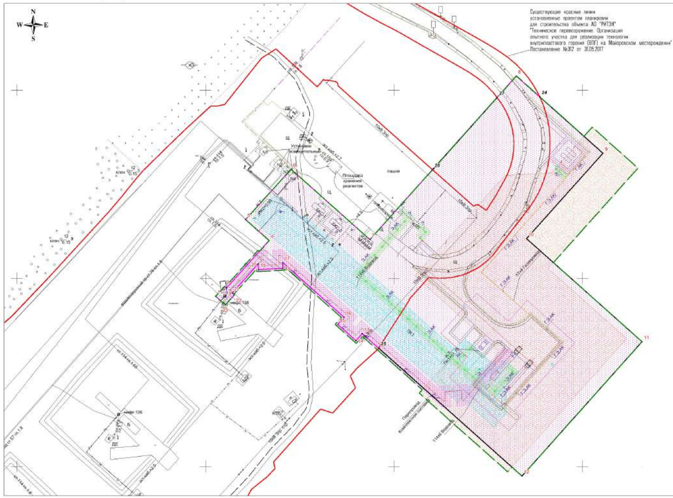
Итого: исходный критерий точек границ зон планируемого размещения линейных объектов