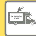
ПОДВИЖНЫЕ ЗВУКОУСИЛИТЕЛЬНЫЕ УСТАНОВКИ