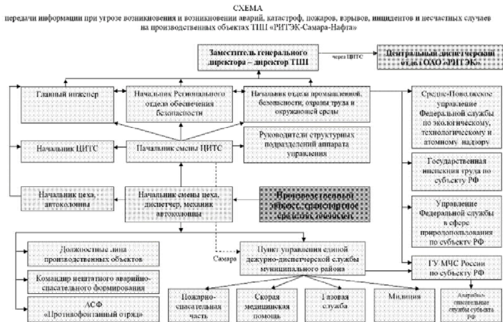
Схема 1. Схема организации взаимодействия, связи и оповещения в случае возникновения ЧС.