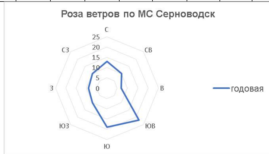
Рисунок 1 - Годовая роза ветров по метеостанции Серноводск

В соответствии СП 20.13330.2016 (карта 2 Приложения Е) исследуемая территория относится к III району по ветровым нагрузкам. Нормативное значение ветрового давления 0,38 кПа.