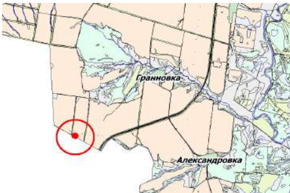
Рисунок 2.1 Обзорная схема участка работ

Местоположение участка работ отображено на рисунке 2.1