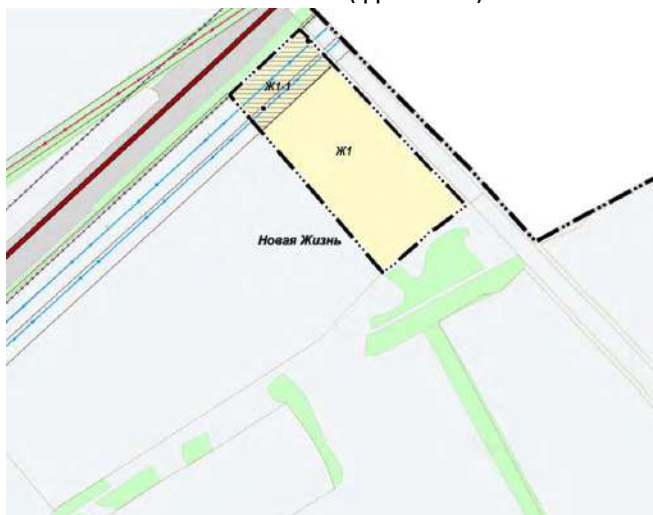
Карта градостроительного зонирования с. Новая Жизнь (фрагмент)