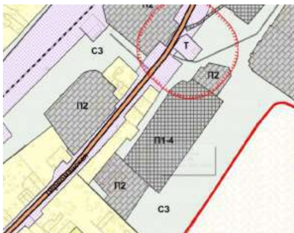
Карта градостроительного зонирования жд./ст. Погрузная (фрагмент)