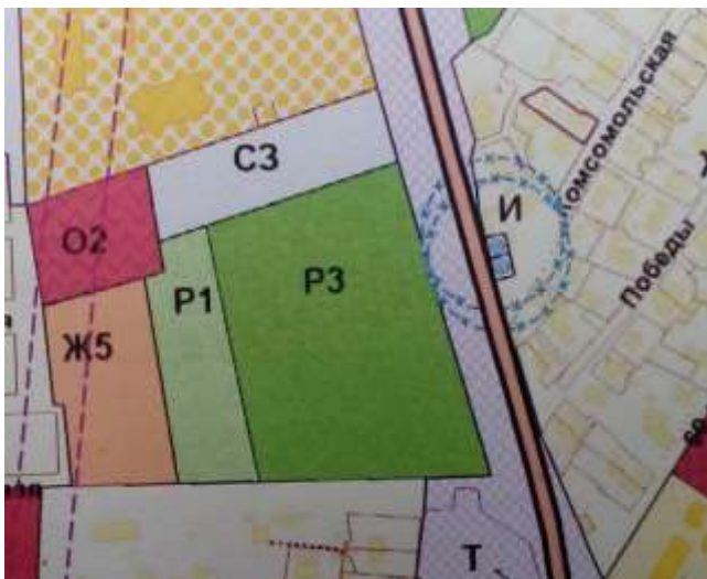
Карта градостроительного зонирования с. Кошки (фрагмент)