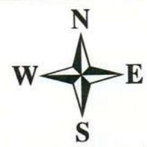
Схема организации улично-дорожной сети и схема движения транспорта на соответствующей территории для строительства объекта АО "РИТЭК" «Обустройство скважины № 215 Аксеновского месторождения» в границах сельских поселений Нижняя Быковка, Шлановка муниципального района Кошкинский Самарской области