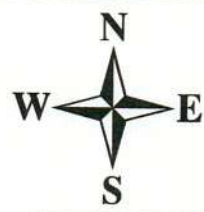
Схема границ зон с особыми условиями использования территории для строительства объекта АО "РИТЭК" «Обустройство скважины № 215 Аксеновского месторождения» в границах сельских поселений Нижняя Быковка, Шпановка муниципального района Кошкинский Самарской области