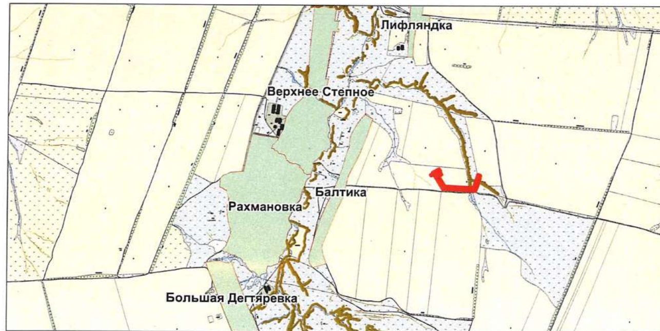
Обзорная схема М 1:50 000