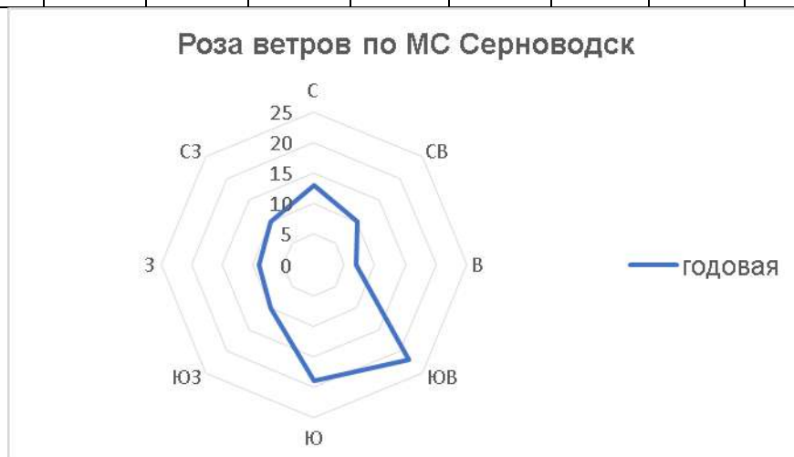
Рисунок 1 - Годовая роза ветров по метеостанции Серноводск

В соответствии СП 20.13330.2016 (карта 2 Приложения Е) исследуемая территория относится к III району по ветровым нагрузкам. Нормативное значение ветрового давления 0,38 кПа.